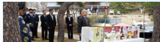
4.24 北竜湖 湖水開き