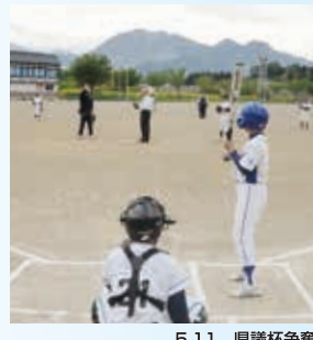
5.11 県議杯争奪 飯山市少年野球大会始球式