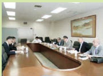
6.10 富山県庁新幹線延伸にむけた取組について

6月10日から12日まで富山・石川県へ現地調査に行ってきました。富山はコンパクトシティを指し取り取り上げられていす。今後の人口減少と高齢化社会を控え、公共交通を活性化させ公共交通を軸とした拠点集中型のコンパクトなまちづくりを目指しています。その機軸となるポータルムについて視察調査しました。富山・石