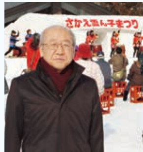
3.16 さかえ雪ん子まつり