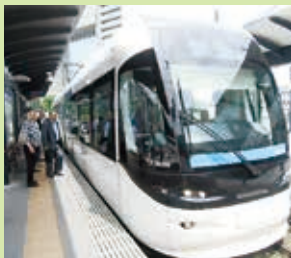
6.10 富山市 ポートラム

川県は日本海に面し、港湾整備によって取扱貨物の増加や客船を利用した誘客についても取組んでいます。また、両県共に新幹線の延伸を控えての観光施策や伝統・文化を活かした地場産業の活性化・ものづくりに力を入れています。最終日には、奥能登総合事務所にて能登空港の運営状況・また新幹線延伸への対応等について視察・調査してきました。抱える課題は、各地共通のものがあります。北陸新幹線の並行在来線の問題や農商工連携等、参考にしてまいります。